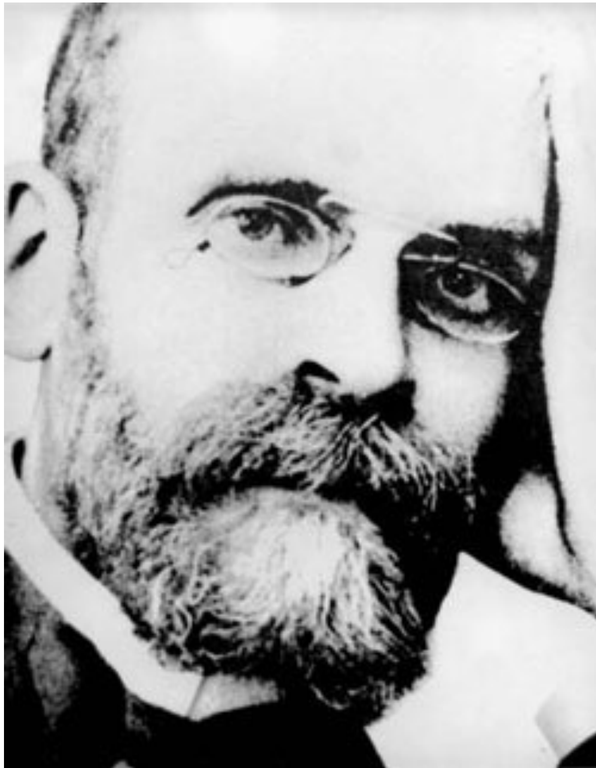
Émile Durkheim 1858.4.15.~1917.11.15.